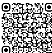
Fabry, maladie de (2011)