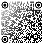
Landau-Kleffner, syndrome de (2012)