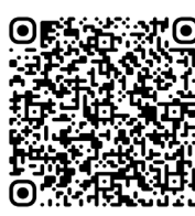
Syndrome sérotoninergique (2018)