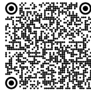
Malformations artérioveineuses médullaires (2018)