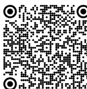
Syndrome de Susac (2020)