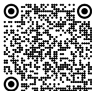
Smith-Magenis, syndrome de (2011)