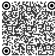
MCAD, déficit en (2021)