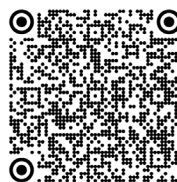
Syndrome malin des neuroleptiques (2017)