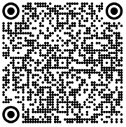
Gaucher type 3, maladie de (2020)