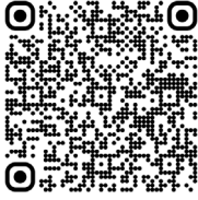
Crigler-Najjar, syndrome de (2022)