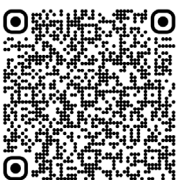
Ehlers-Danlos vasculaire - type IV (2017)