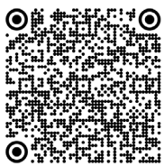
Leucine - Maladie des urines sirop d'érable (2020)