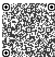
Andersen - Syndrome de paralysie périodique sensible au potassium-dysrythmie cardiaque (2017)