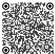
Stevens-Johnson, syndrome de (2019)