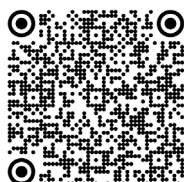
Syndrome des spasmes infantiles - Syndrome de West (2020)