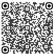
Dystrophie musculaire de Duchenne (2020)