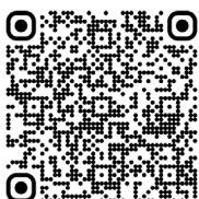
Anémie de Fanconi (2015)