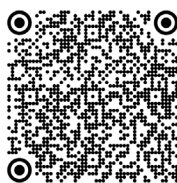
Steinert, dystrophie myotonique de (2010)