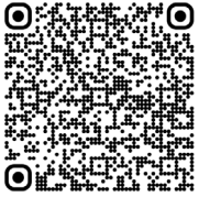
Déficit en alpha1-antitrypsine (2021)