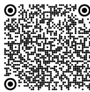
Malformation artérioveineuse cérébrale (2018)