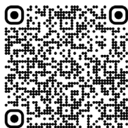
Amylose AL (2015)