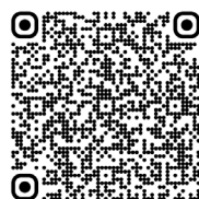
Antiphospholipides, syndrome des / syndrome catastrophique des antiphospholipides (2017)