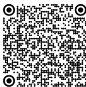
Sturge-Weber, syndrome de (2021)