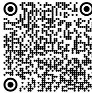
Marfan, syndrome de (2017)