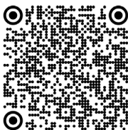
Lennox-Gastaut, syndrome de (2020)