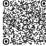
Déficits du cycle de l'urée (2023)